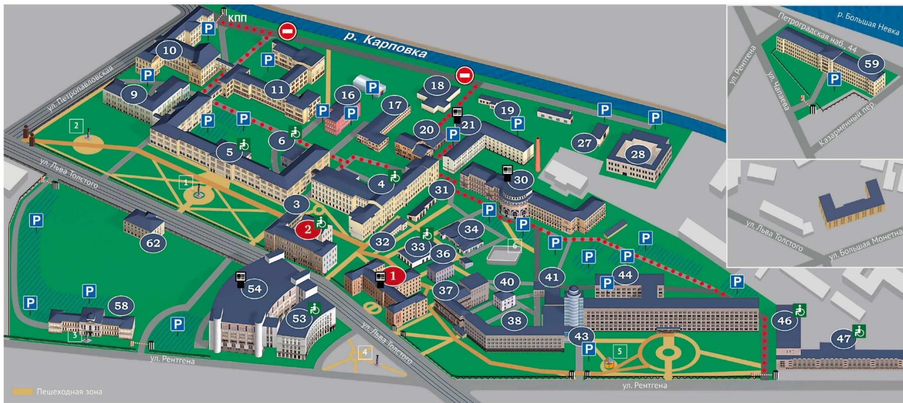
Схема расположения корпусов Первого СПбГМУ им. акад. И.П.Павлова

Первый Санкт-Петербургский государственный медицинский университет имени академика И.П.Павлова