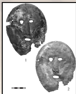
Погребальная маска X в. и её 3D копия из гипсополимера из коллекции МАЭ