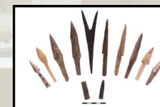
Костяные стрелы Средних веков из коллекции МАЭ