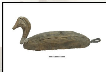
Деревянная утка-поплавок для сети Начало XX в. из коллекции МАЭ