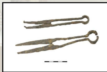
Ножницы для стрижки овец, 2-я половина II тыс. н.э. из коллекции МАЭ